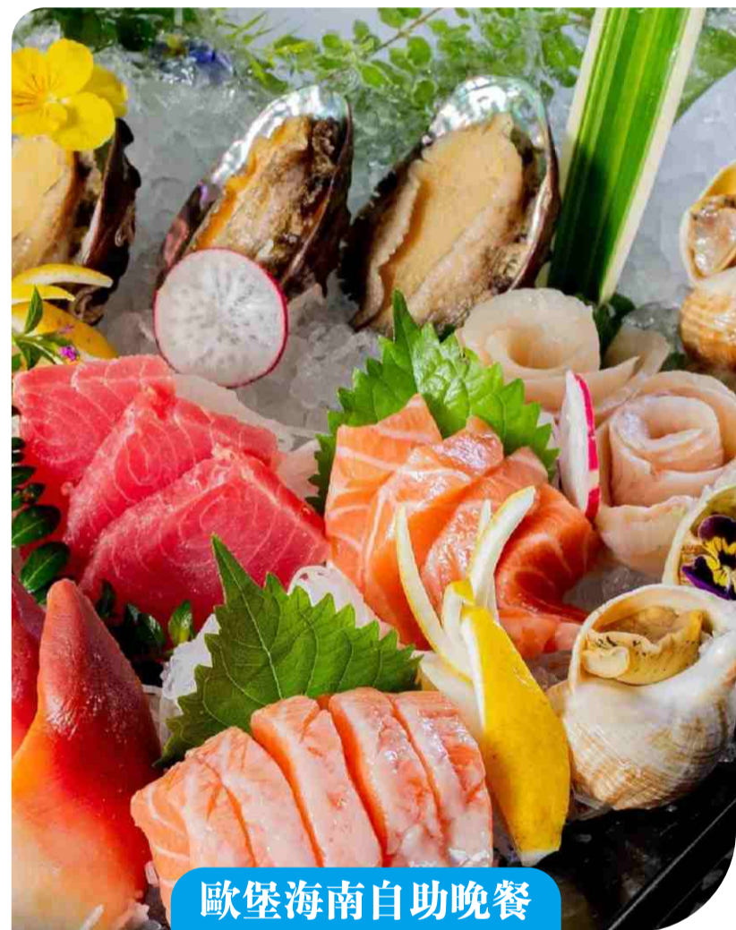
歐堡海南自助晚餐