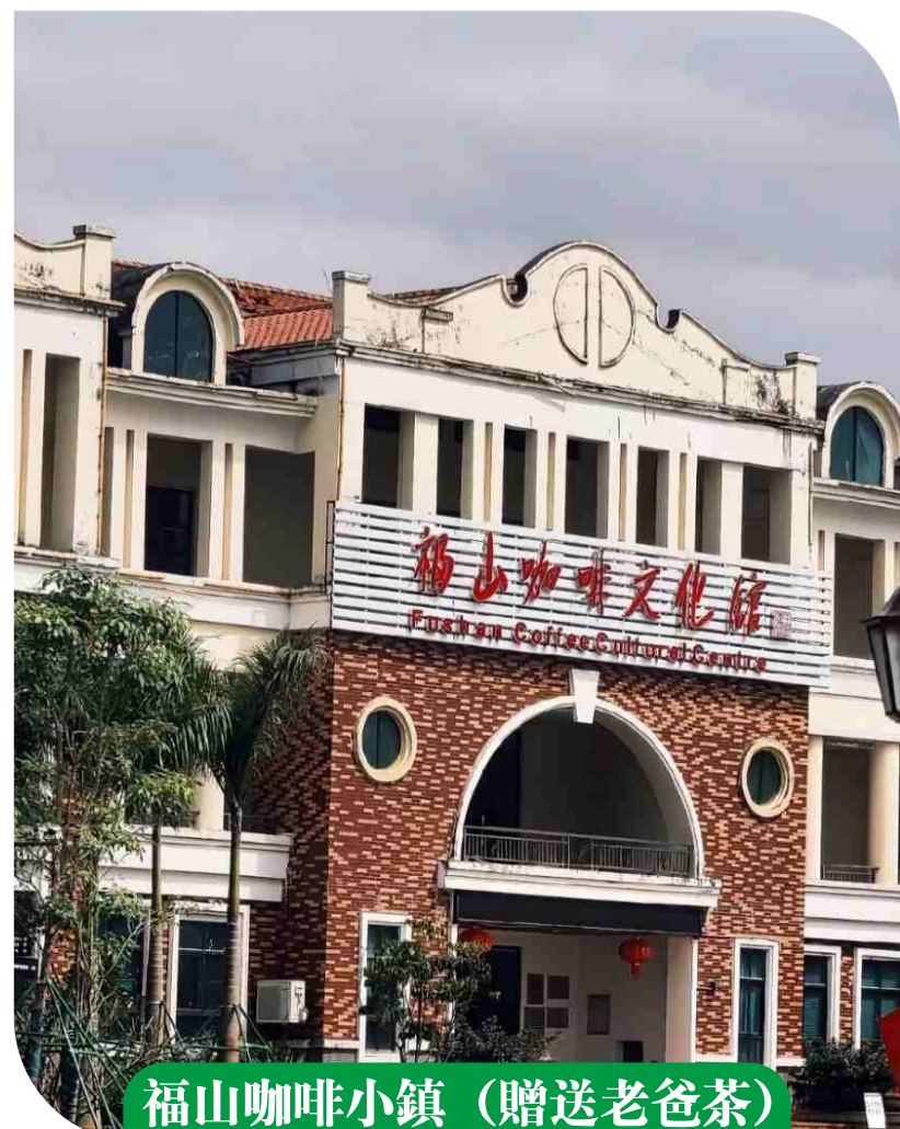
福山咖啡小鎮 (贈送老爸茶)